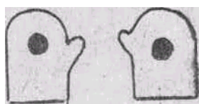
Рис. 1. Тренажер «Солнышко»

Для изготовления тренажера нужен материал темного цвета, из которого шьются две рукавички. Из желтой, красной или оранжевой материи вырезаются два кружка размером 4-5 см. Они нашиваются в центр ладонной поверхности рукавичек снаружи.